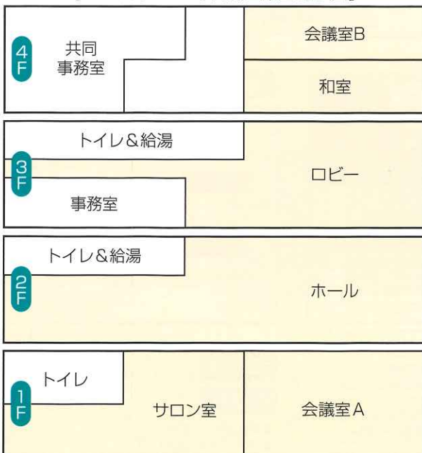
【ウエスト100(本館) 部屋割り図】

は同駅より北へ10Mの意味です。いずれも賃貸物件ですが、内部は4600万円かけて改装した新品(?)です。ホール、スタジオ、会議室計8室、共同事務所などです。