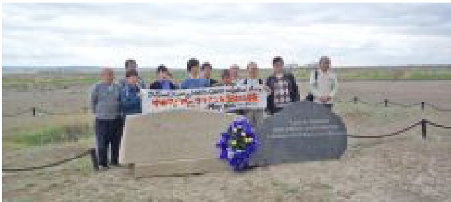
中央アジアのコーリアンを訪ねる旅 2010.4.30～5.8 カザフスタン、ウストベにて

(レポートが『むくげ通信』240号、2010.5にあります。希望者は、80円切手4枚をお送りください。)