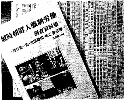
戦時朝鮮人強制労働調査資料集。朝鮮人の名簿や連行先が記載されている