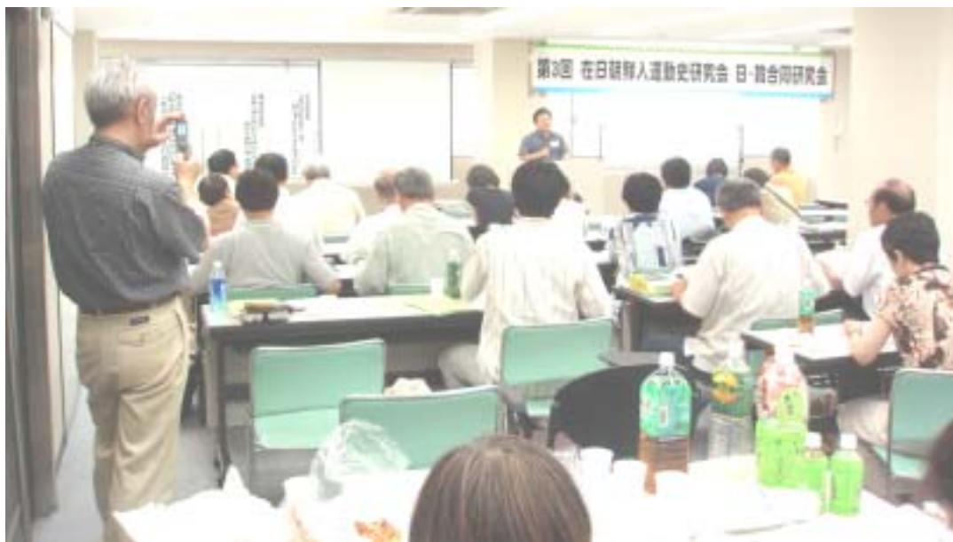
第3回在日朝鮮人運動史研究会 日・韓合同研究会 2007.8.4~5 於 / 東京

青丘文庫研究会 〒657-0064 神戸市灘区山田町3-1-1 (財)神戸学生青年センター内 TEL 078-851-2760 FAX 078-821-5878 http://ksyc.jp/sb/ e-mail hida@ksyc.jp 在日朝鮮人運動史研究会関西部会 (代表・飛田雄一) 朝鮮近現代史研究会 (代表・水野直樹) 郵便振替 < 00970 - 0 - 68837 青丘文庫月報 > 年間購読料 3000 円 他に、青丘文庫に寄付する図書を購入費として 2000 円 / 年をお願いします。