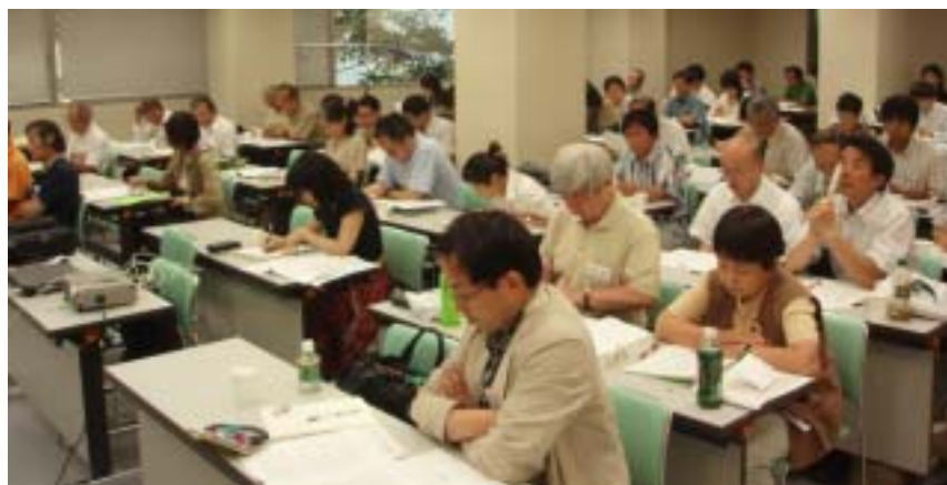
熱心な参加者たち