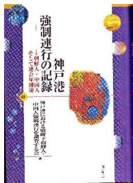
『神戸港強制連行の記録』 －朝鮮人・中国人・連合軍捕虜－