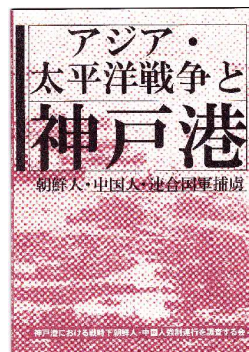
『アジア・太平洋戦争と神戸港』 －朝鮮人・中国人そして合軍捕虜－