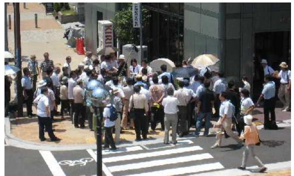
神戸華僑歴史博物館前