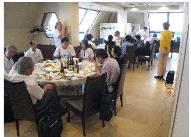
<神戸港平和の碑>完成祝賀会 雅苑酒家