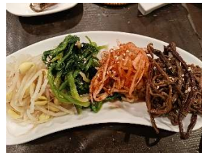
(ピーナツとO、名前を忘れたが美味しかった/ナムル)