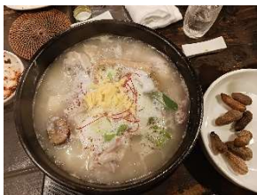
(サムゲタン、クツグツといっています)

コロナも終わり、グルメの会が復活しています。が、私は今年8月にコロナにかかりました。3回、ワクチンを売ったので、3打数1安打です。友人で、ワクチン7回、コロナ4回。7打数4安打の人がいました。びっくりです。