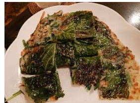
(チジミ、セトリとエゴマ。写真を撮るまえにとられてしまいました)

2019年のネット記事に「暑い夏は韓国料理で元気に!神戸・六甲道で25年!」とあります。ということは、30年前に開店したことになります。