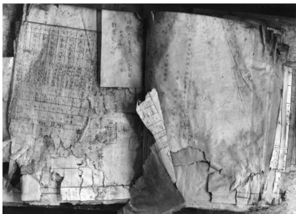
(旧・川西航空機の文書。焼け残ったもの?)

が回答とともに提供された文書のなかに神戸勤労所長と県との交換文があったのである。この文書によって初めて厚生省名簿の作成経緯等が明らかになったのである。