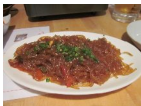
春雨です。That's all でした。

今回のグルメの会、難産だった。ぎりぎりまで会場が決まらない。結局担当となった飛田がそのために三宮をうろうろして発見したのが、ここ。場所は東急ハンズ西 50 メートルの南側というので分かりやすい。鍋料理、飲み放題で 4,000 円というのを注文しておいた。