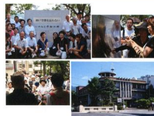
開催日 2014年8月23日(土)・24日(日) 会場 神戸市立御影公会堂 ホール 後援 神戸市・神戸市教育委員会 兵庫県・兵庫県教育委員会