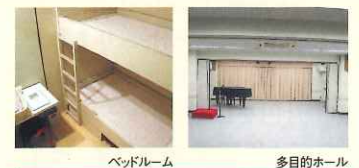
ベッドルーム 多目的ホール

●営業目的の会場使用は、10割増となります。 ●ピアノ使用は1口1,080円(スタジオ)、3,240円(ホール)