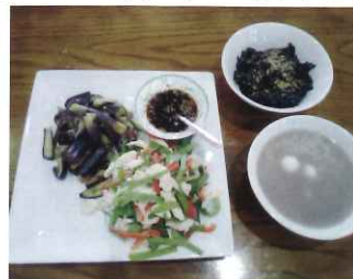
なすとささみの冷菜・小豆のおかゆ 10.6