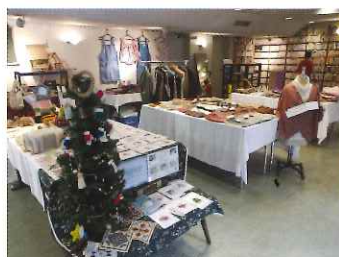
ロビーのクリスマス販売