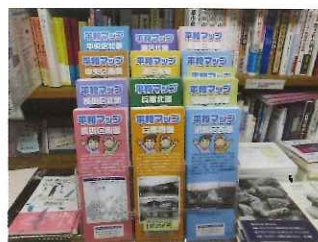
平和マップ、 ロビー書店で発売中