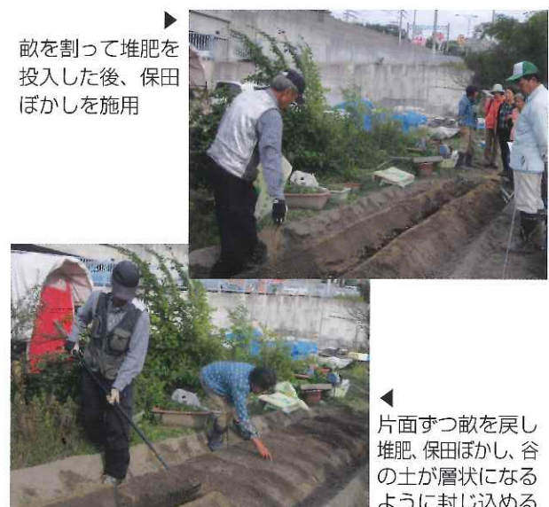
▶ 畝を割って堆肥を投入した後、保田ぼかしを施用

今回の農塾の参加者からは、実際に保田ぼかしを自分自身で作ることによって、作り方はもちろんのこと、畑への施用方法などを学ぶことができ、有意義な勉強会になったという意見が寄せられました。家庭菜園や農業に関心がある方も多いと思いますが、皆さんも「保田ぼかし」を実践してみたいかがでしょうか。