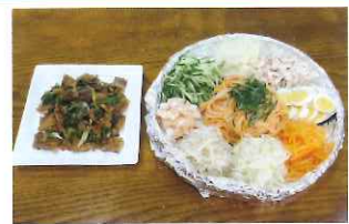
チェンバックス・ブゴッチム 3.3

毎月第1土曜はとても美味しい香りが事務所に届きます。いつも使っている食材の韓国風味付を学ぶと、レポートリーが倍増?献立を考えるのが楽しくなりそうです。