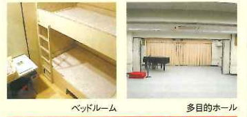
ベッドルーム 多目的ホール

●営業目的の会場使用は、10割増となります。 ●ピアノ使用は1口1,080円(スタジオ)、3,240円(ホール)