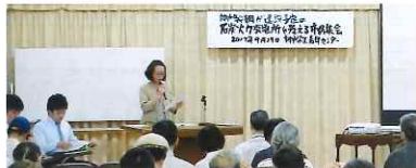
石炭火力発電所を考える集会 9.29

神戸の石炭火力発電を考える会と共催で開催しました。神戸製鋼が計画している2基の大きな火力発電所を問う集会です。