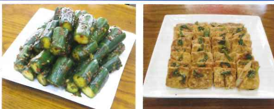
キュウリのキムチ 9.2

自分ではなかなか使わない食材が含まれていたりして、うれしいビックリ!!にあえる教室です。冬から春にかけてのメニューも美味しそうなものが並びます。みなさまのご参加をお待ちしています。