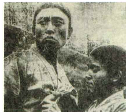
1926年上映の映画「アリラン」の1シーン、羅雲奎

1970年3月から1975年3月までソウルにいて、観る映画、観る映画つまらなくて…噂を聞いて劇場に行くと上映禁止!で…私も韓国映画離れしていた。映画のみならず演劇も歌も…日本では考えられない言論弾圧の怖さを体感できたのが唯一の留学土産だった。だから『風吹く良き日』(1980)を観たときの喜びは計り知れない。維新政権崩壊(1979年末)が韓国映画の突破口を開いたという嬉しい実感が韓国映画を日本に紹介したい…という私の心の扉を開いたのだと思う。