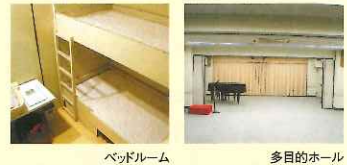
ベッドルーム 多目的ホール

● 営業目的の会場使用は、10割増となります。 ● ピアノ使用は1口1,080円(スタジオ)、3,240円(ホール)