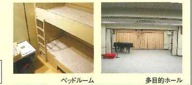
ベッドルーム 多目的ホール

●営業目的の会場使用は、10割増となります。 ●ピアノ使用は1口1,080円(スタジオ)、3,240円(ホール)