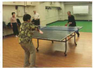
楽しくやっています

センターには卓球台があります。朝鮮語講座のあとなどに卓球大会が開かれていました。10月から本格的に(?)復活しました。第1水曜、午後6時半から8時半です。汗を流したあとは有志のビールの会です。参加費300円、月に1回、卓球で汗を流しましょう。