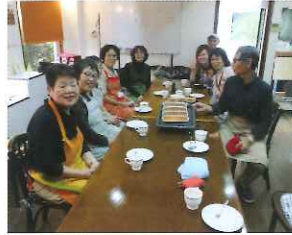
できました リンゴジャムのパウンドケーキ 11.16