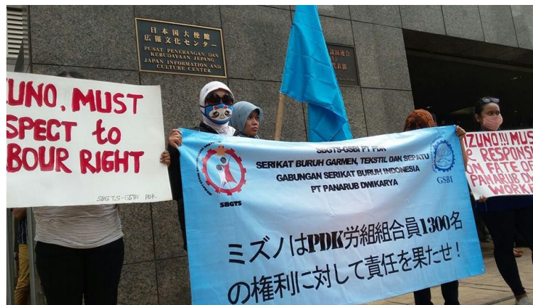
▲2015年8月20日 インドネシアの日本大使館前で、抗議行動を行うGSBI ミズノの下請け企業での1300人の解雇問題で

インドネシアからは、GSBIが参加する 民衆闘争戦線（FPR）の方を予定 https://fprsatumai.wordpress.com/