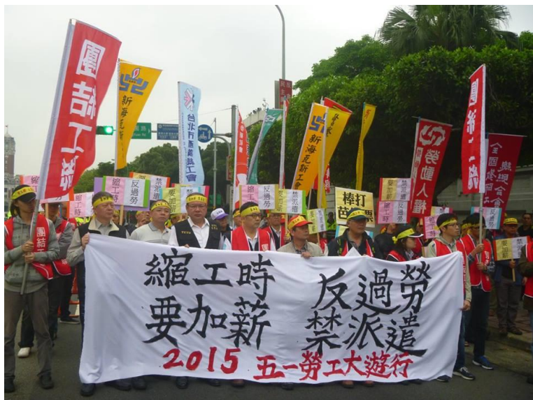
▲台湾「2015年五一行動聯盟」のメーデーに向けたアピール 右側の方に「労働人権協会」のノボリ