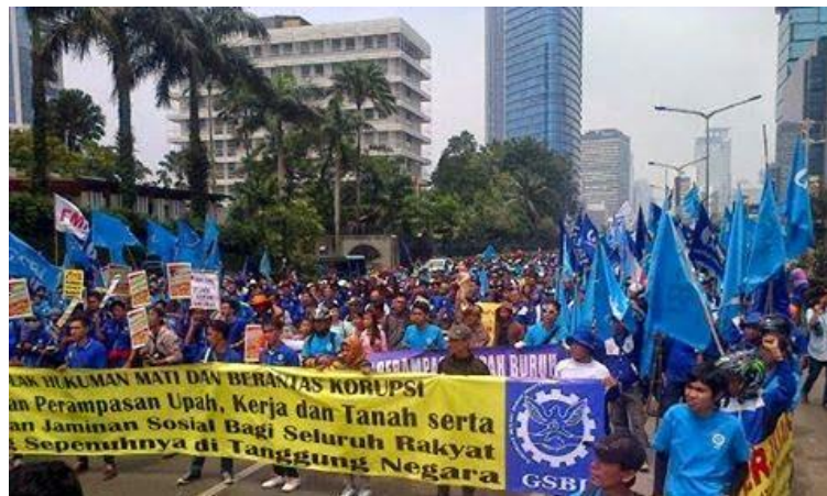
▲インドネシアの2015年メーデー