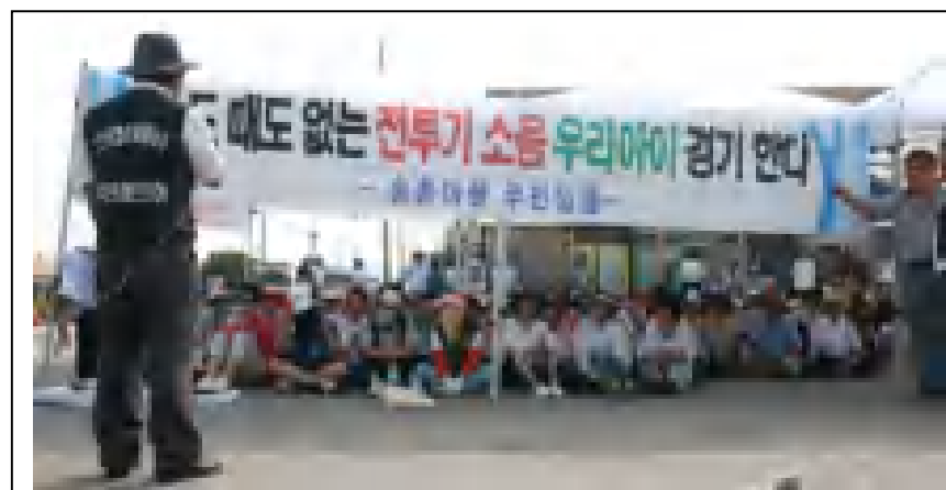
米軍機の夜間飛行中止を求める抗議集会(2011年8月3日・群山) 群山(クンサン) 米軍基地は、烏山空軍基地と並ぶアメリカ第7空軍の主力基地で、F-16戦闘機を装備した第8戦闘航空団が所在しています。基地周辺住民は、騒音被害等様々な被害を被っています。